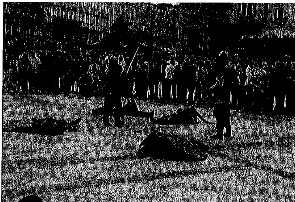
Pokaz Bractwa Historycznego Winland.