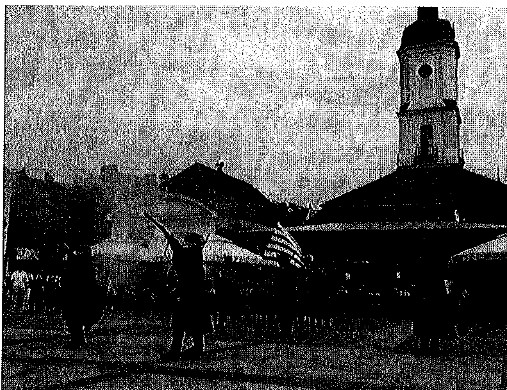
Pokaz Komputowej Chorągwi Stefana Czarnieckiego.