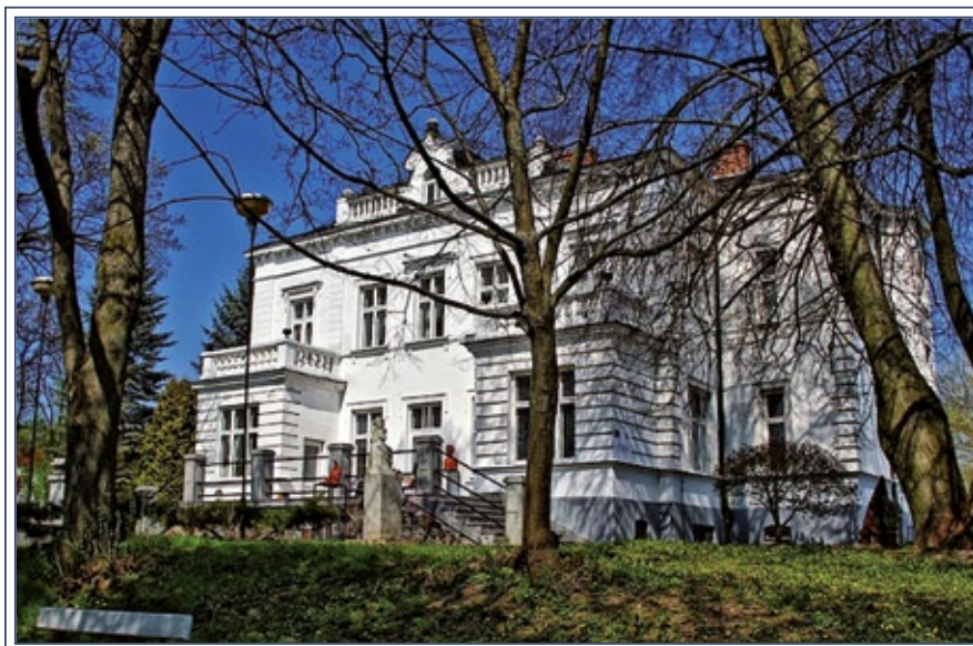
Dwór Lutosławskich w Drozdowie, obecne Muzeum Przyrody