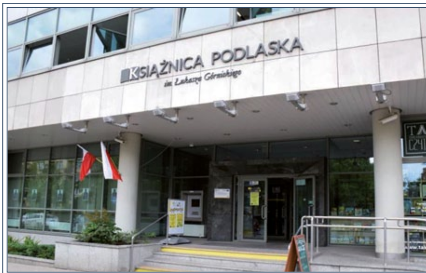
Książnica Podlaska im. Łukasza Górnickiego w Białymstoku