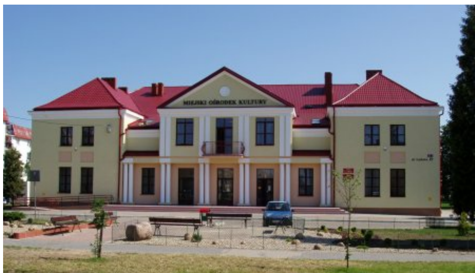
Miejski Ośrodek Kultury