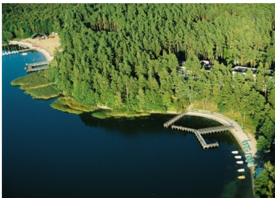
Ośrodek wypoczynkowy Knieja i Energetyk

Góra Zamkowa w Rajgrodzie - wzniesienie o stromych zboczach sięgające do 15 m. nad poziom wody, znajdujące się na półwyspie Jeziora Rajgrodzkiego najstarsza część Rajgrodu W przeszłości było to grodzisko jaćwieskie, następnie gród książęcy, a od 1571 do końca XVIII wieku dwór starosty rajgrodzkiego. Obecnie z wierzchołka góry podziwiać można malowniczą panoramę jeziora i okolice; na zboczu góry estrada, a u jej podnóża plaża miejska.