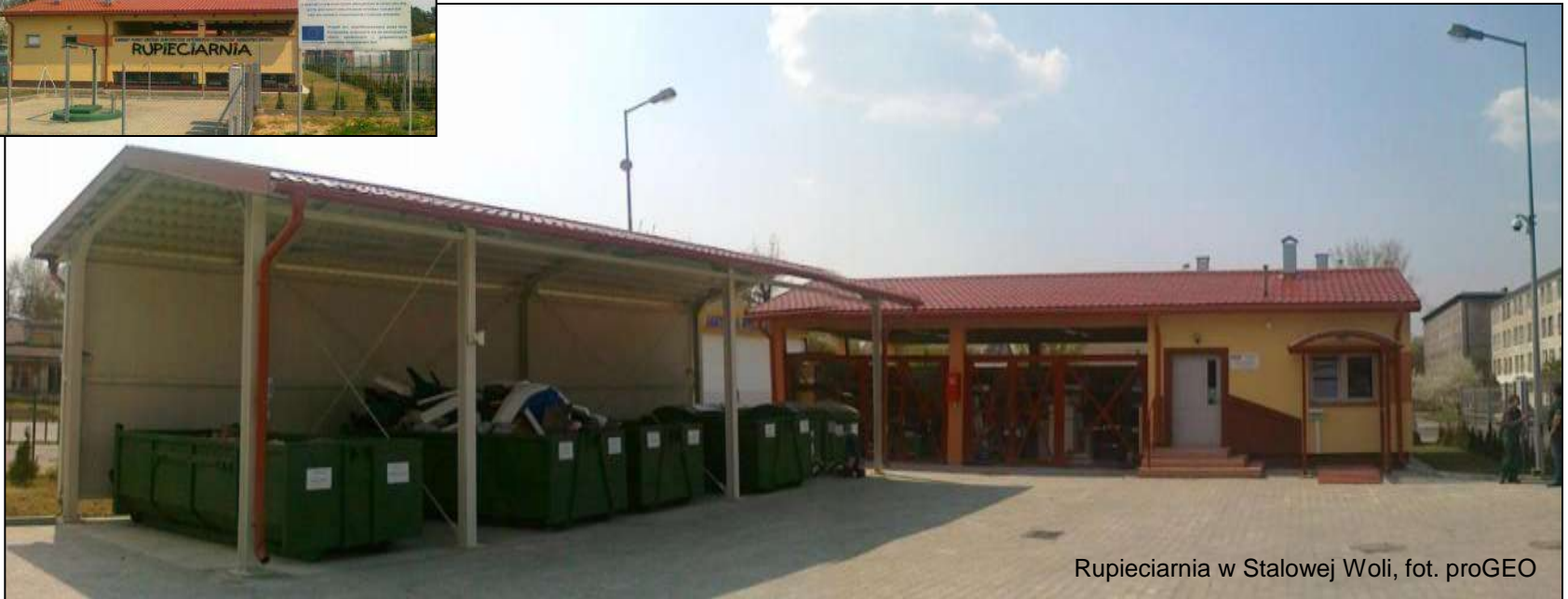
Rupieciarnia w Stalowej Woli