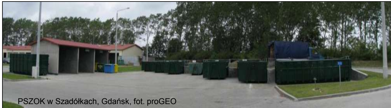
PSZOK w Szadółkach, Gdańsk