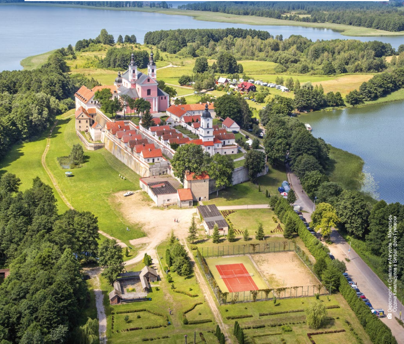
Окрестности г. Сувалки и Августов – Монастырь Ордена Камальдулов в Виграх

Богатством этой территории также является, находящийся на глубине 482 метров источник минеральной воды Августовянка. Августовская Пуца привлекает туристов своей сетью велосипедных и пешеходных маршрутов. Также здесь проведён