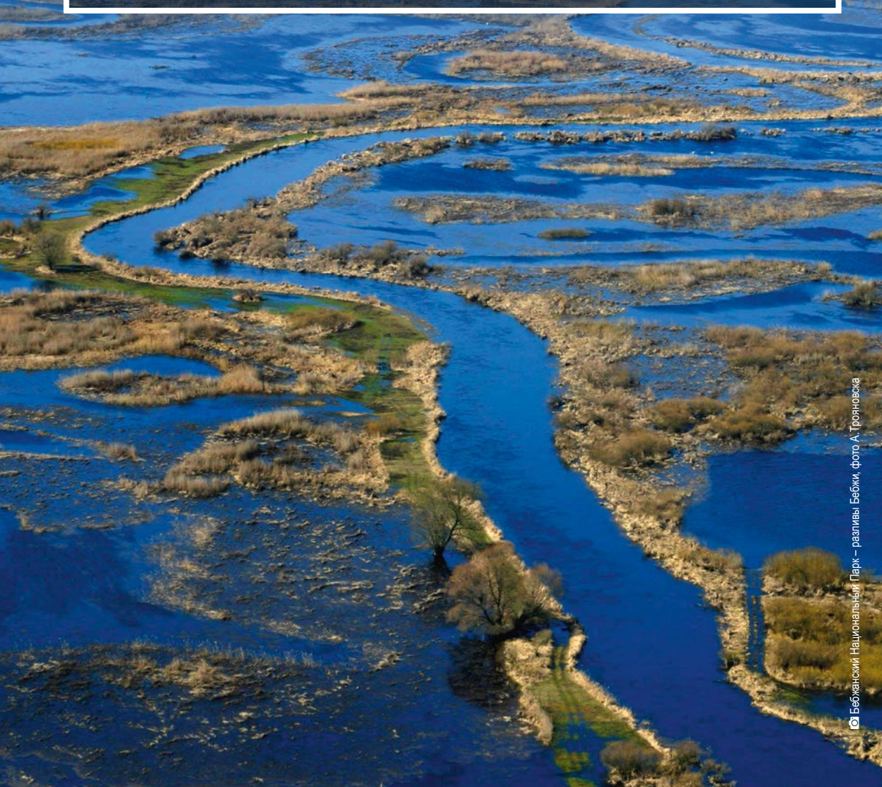
Бебжанский Национальный Парк – разливы Бебжи, фото А. Трояновска

Изобилие торфяников и болот, окружающих извилистое русло реки, царство лося и множество видов диких пернатых – так можно описать Бебжанский Национальный Парк, самый большой охраняемый парк в Польше. Планируя посещать эти места стоит прихватить с собой бинокль и резиновые сапоги. Путешествуя, от рассвета до заката, по Бебжанскому Национальному Парку, можно увидеть множество разнообразных видов растений и животных. В наблюдении за ними помогают помосты и смотровые вышки. Бобровые плотины, журавлиные ключи – можно постоянно восхищаться природой окрестностей Бебжи, независимо от времени года.