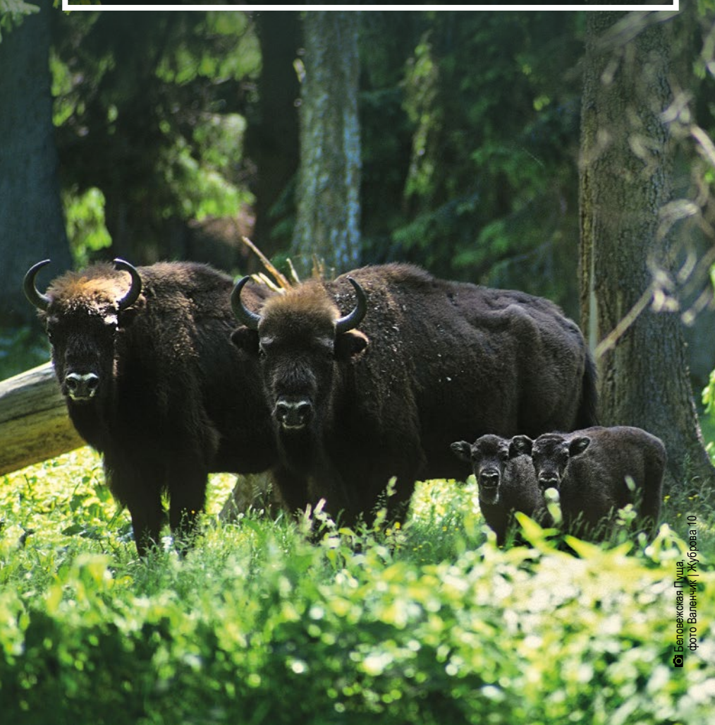
Беловежская Пуца 10

(около 1250 км²). Не нарушенные человеком экосистемы с богатой флорой и фауной, 500-летние лесные массивы охраняются