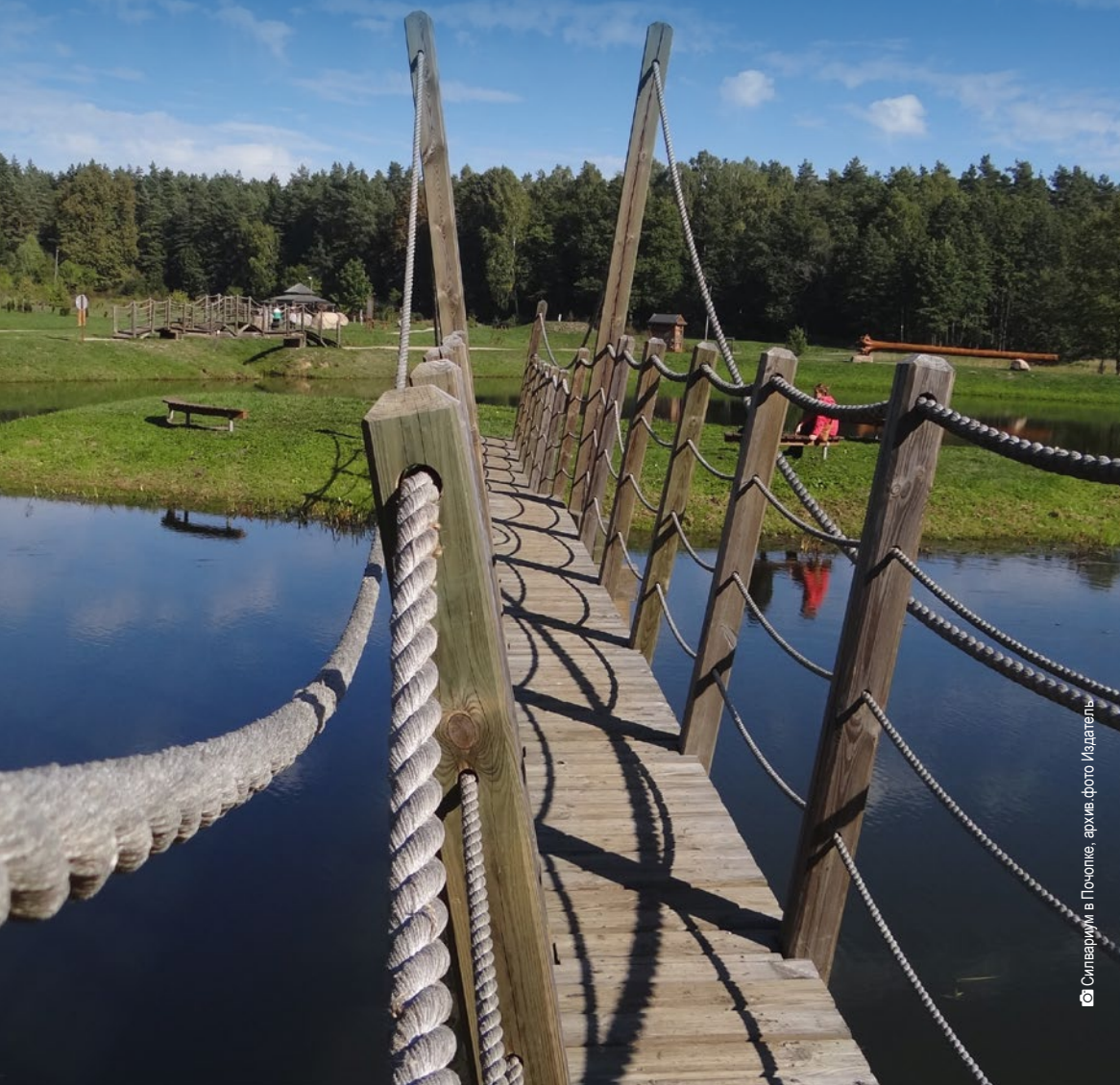
Силвариум в Почопке, архив. фото Издатель

Лесной сад, дендрарий, деревянные кресты, могилы повстанцев, смотровые вышки, познавательные трассы, живописные речные долины – все эти тайны скрывает Кнышинская Пуца. По соседству с бобровыми плотинами можно увидеть ястреба-осоеда а рядом с торфяником место гнездования тетерева. Территорию Кнышинской Пуцы покрывает целая сеть туристических маршрутов, демонстрирующих природные и исторические достоинства этого района.