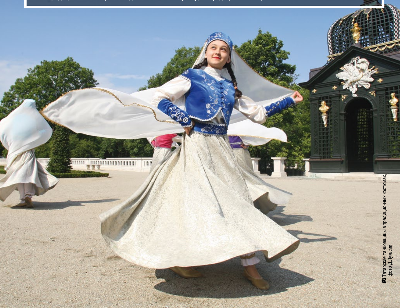
Татарские танцовщицы в традиционных костюмах

становятся разноцветной сценой, на которой звучат мелодии разных народов, жителей подляского воеводства а также самых отдалённых районов мира. Люди танцуют, учатся играть на народных инструментах, восхищаются яркими узорами традиционных национальных костюмов.