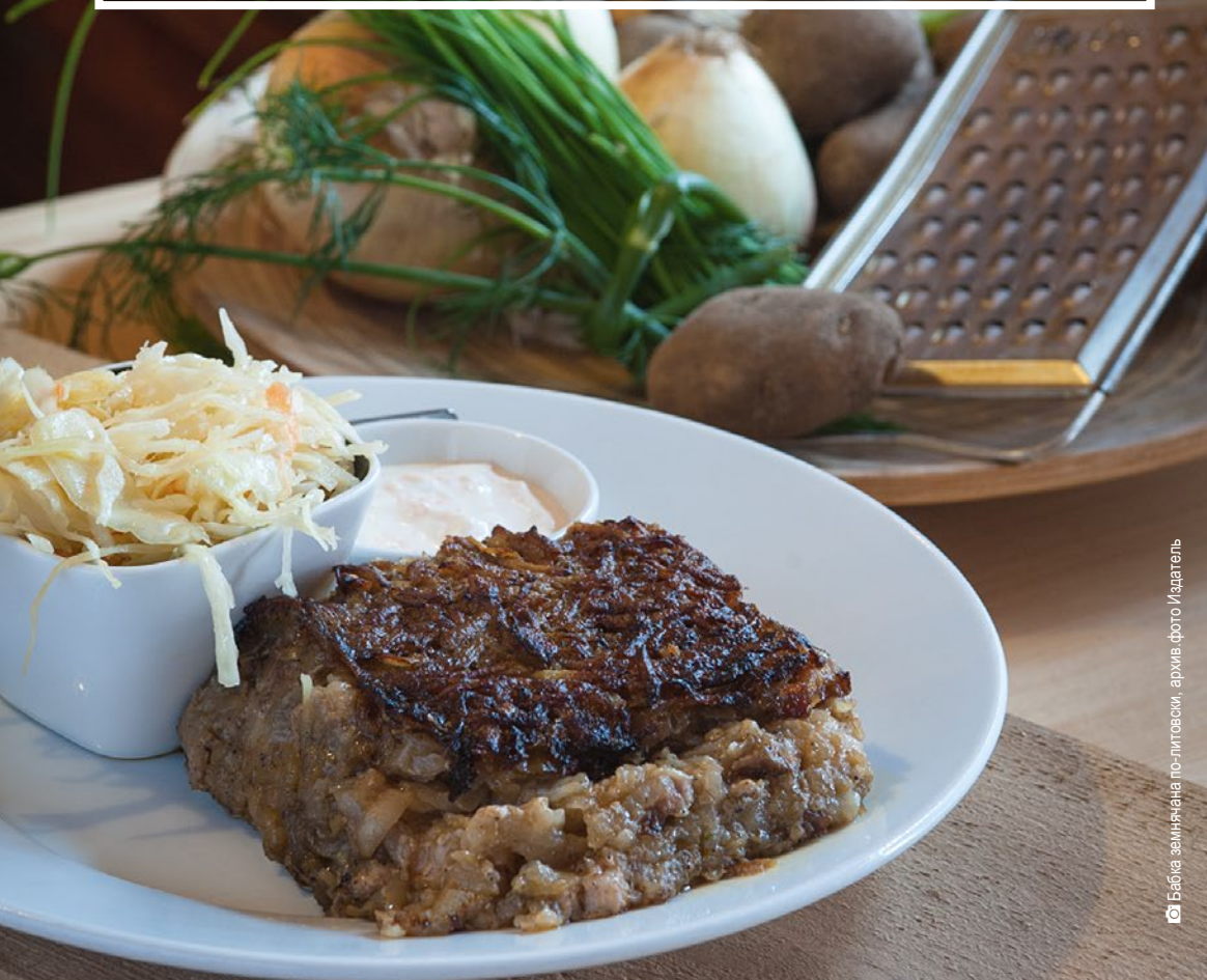
Бабка земнячана по-литовски.

«Саскрыдис» и Фестиваль Музыки Молодой Беларуси «Басовица» – это такие, повторяющиеся ежегодно мероприятия, которые притягивают огромное количество заинтересованных. Эти фестивали, также как Подляская Октава Культур, прекрасно иллюстрируют разнообразие культур и гостеприимство региона.