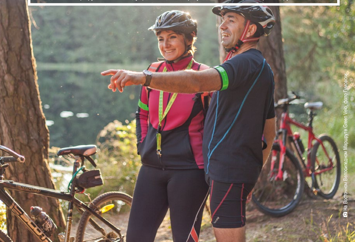
На Восточном Велосипедном Маршруте Green Velo