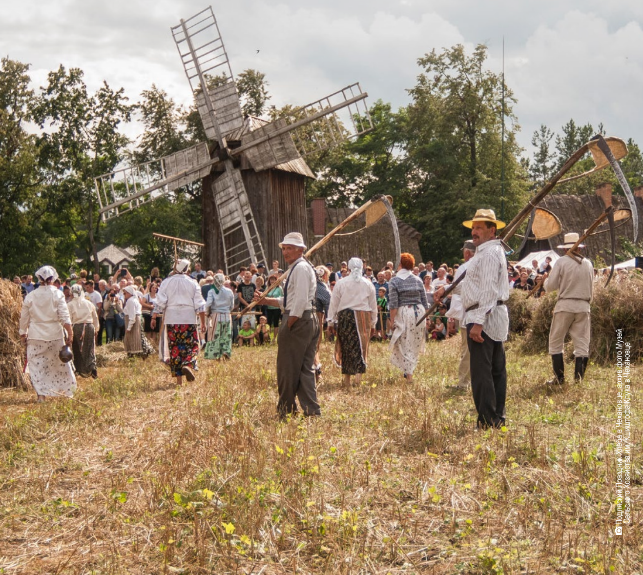
Подляский Праздник Хлеба в Чехановце, архивного Музей Сельского Хозяйства им. Кушторна Клука в Чехановце

Клубничное дефиле моды, презентация традиционной выпечки хлеба в полевой печи, прекрасные произведения церковной музыки в абсолютно неповторимом окружении природы. Подляское воеводство предлагает множество мероприятий, благодаря которым Вы познакомитесь с характером, вкусом и климатом региона.