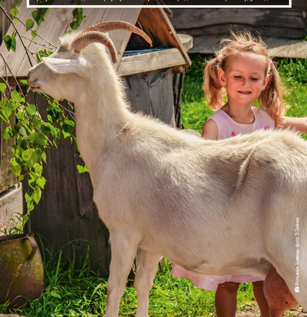
Фольварк Ховены

Почорке. Это место создано специально для семейных посещений. Тут дети рассмотрят тропы диких зверей, увидят как выглядят совы и смогут побегать в Парке Мегалитов, а их родители в это время будут отдыхать