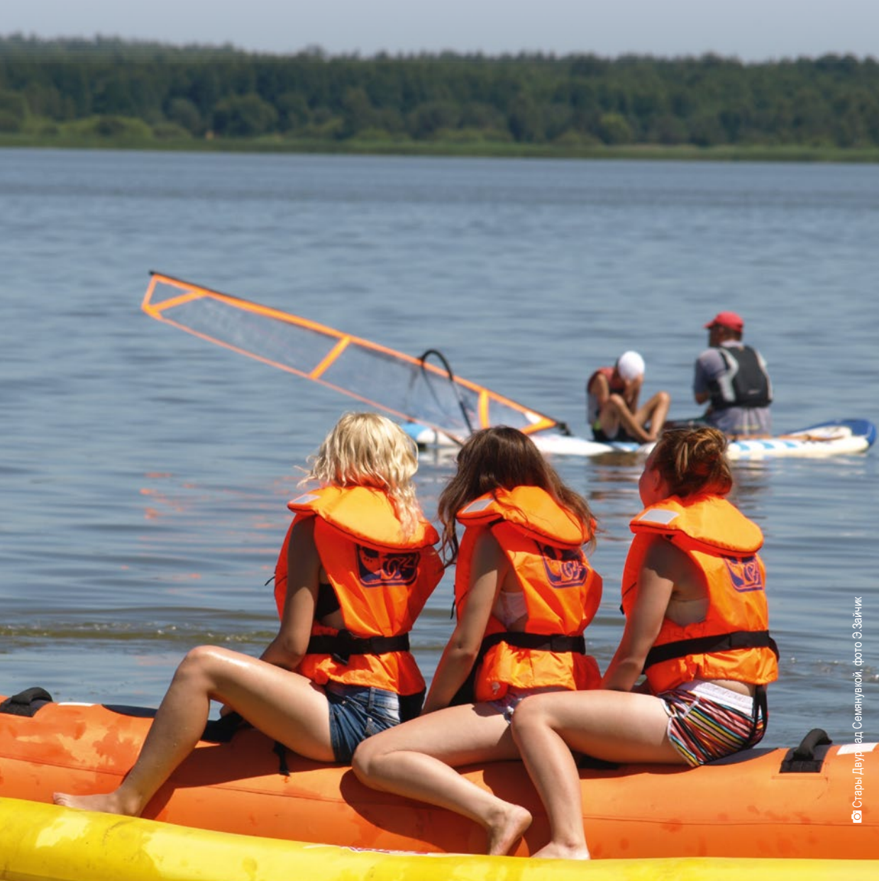
© Стара Двуряд Семьянукой, фото Э. Зайчик

На канатах и скалодромах, в бассейнах и под парусами, на лыжах или на велосипедах – Вы отлично проведёте время со своими детьми! В подляском воеводстве в любое время года можно активно провести семейный отпуск, например в центрах водного спорта или в канатных парках.