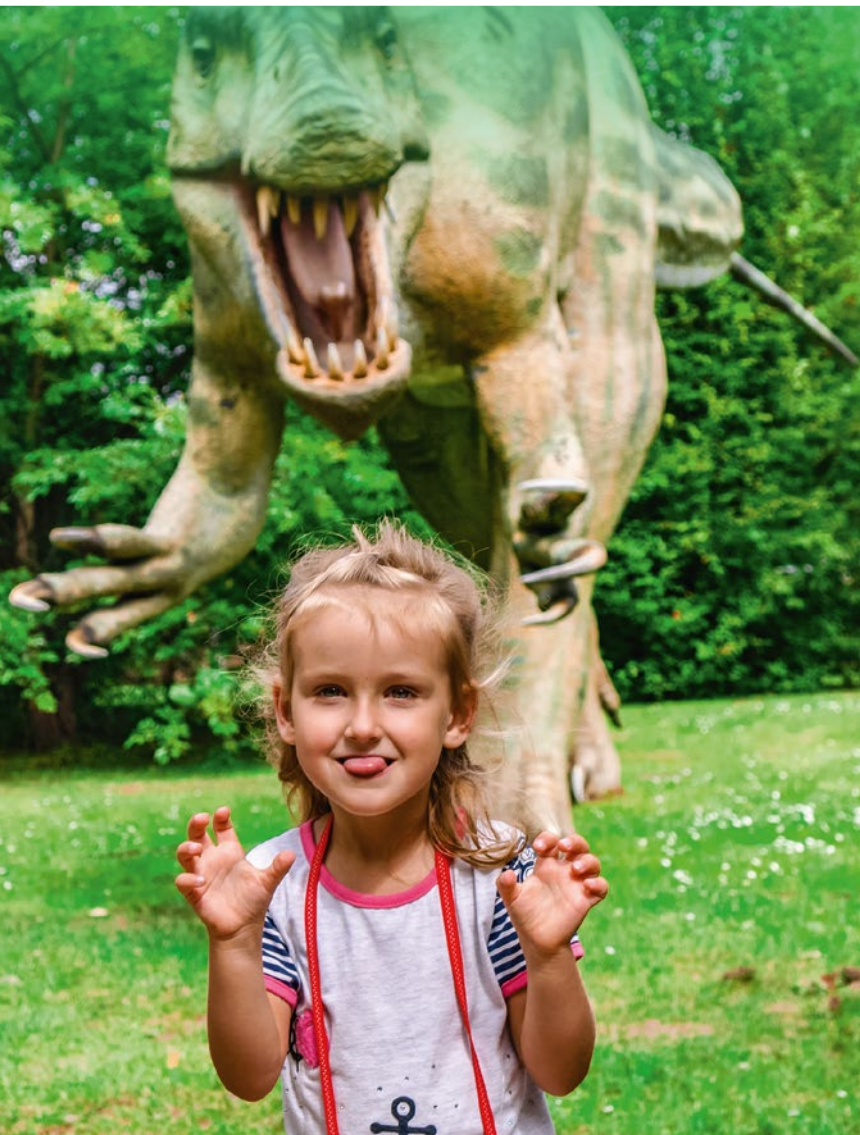
Парк Динозавров в Юровцах

Время проведённое вместе с детьми – это самое ценное, что мы можем им дать. Как использовать это время чтобы оно принесло как можно больше пользы для развития ребёнка? Предлагаем организовать отдых с элементами истории: покажите детям старые пожарные машины, возьмите их в парк динозавров, дайте им возможность представить себя хозяином фольварка в давней деревне или погуляйте вместе с ними по музею под открытым небом.