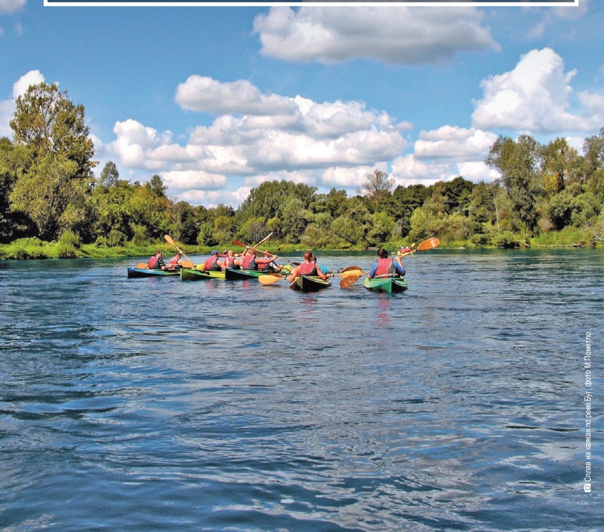
Сплав на каяках по реке Буг

Богатую природу подляских рек лучше всего наблюдать непосредственно, например с каяка. По Бебже можно путешествовать сплавляясь на речном плоту, а на Нареве Вас могут удивить традиционные лодки с одним веслом. Обширные болота и торфяники, огромное разнообразие видов птиц, которые тут гнездятся а также лось – царь этой территории – очень характерны для Бебжи. Нарев, со своим множеством притоков, который изгибается и вьётся, окружённый заболоченными пространствами, назван «польской Амазонкой». Буг перенесёт Вас в южную часть региона – живописную и отличающуюся своим культурным разнообразием.