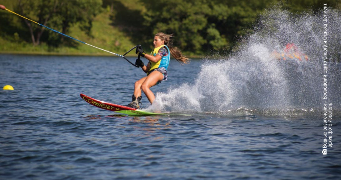
Водные развлечения — Воеводский Центр Спорта и Отдыха Шелмент