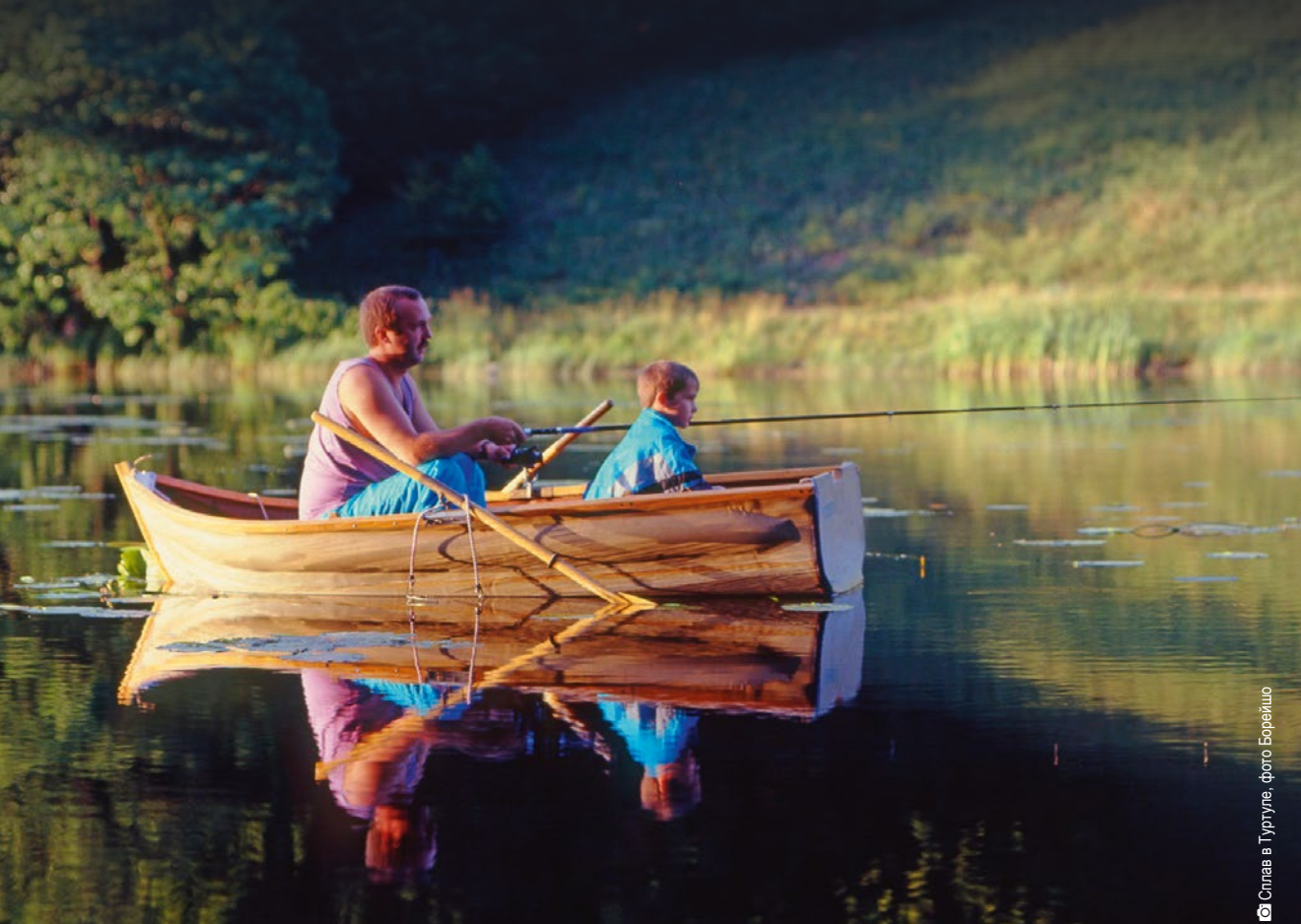
Слева в Тургуле

Рыболовные тони, находящиеся на многочисленных озёрах и реках подляского воеводства притягивают любителей рыбалки. Особенным предпочтением рыболовов пользуется значительных размеров водоём Семянувка. Превосходная рыбалка возможна также и в северной части воеводства, в августовских озёрах и в центрах подготовленных специально для «отдыхающих с удочкой», например: у озера Бокше. В регионе также есть много мест, где можно попробовать вкусные блюда приготовленные из местной пресноводной рыбы.