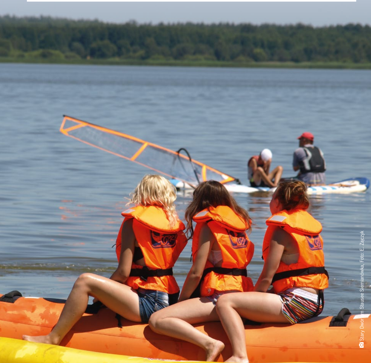
© Sławy Dwór in Stausee Siemianówka, Foto: E. Zajczyk

An Seilen und Kletterwänden, in Schwimmbädern, auf Segelbooten, Skiern oder Fahrrädern – all das erlaubt es Kindern ihre Energie auf positive Weise auszuleben! Unabhängig von der Jahreszeit kann man in der Woiwodschaft Podlaskie den Familienurlaub aktiv verbringen, z. B. in Wassersportzentren oder Seilgärten.