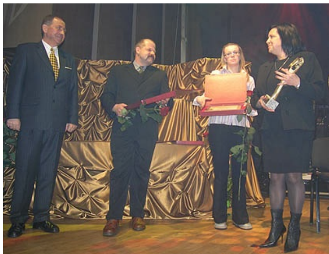
Nagrodzeni w kategorii MIEJSCE

Napój na spirytusie wyrabiany z owoców leśnych, malin, jeżyn, oraz żurawiny. Posiada niezwykle oryginalny smak.