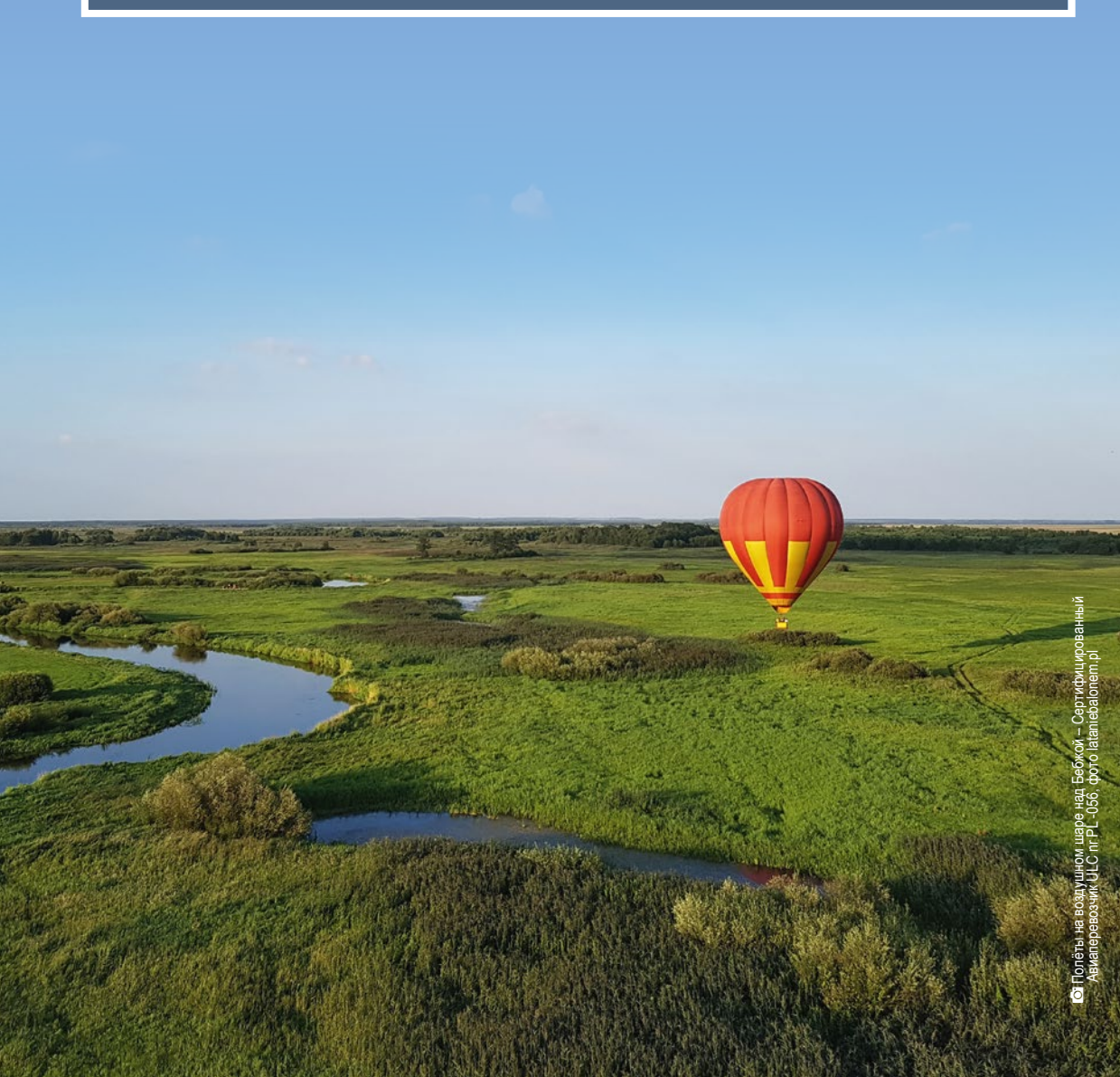
Полёты на воздушном шаре над Бебжой – Сертифицированный Авиатерозчик ULC nr PL-056

Любители активного отдыха с добавкой экстрима, наверняка заинтересуются такими развлечениями как пейнтбол, офф-роуд или зиплайн. Для этого, ландшафт Подлясья очень благоприятен – здесь много холмов, лесов, оврагов и озёр, рядом с которыми располагаются центры активного отдыха. Экстремальный туризм в подляском воеводстве – это канатные парки, скалодромы, езда по бездорожью, пейнтбол и полёты на воздушном шаре.