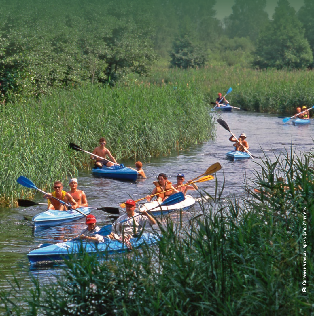
Сплавы на каяках.

Туристам, которые предпочитают отдых у воды, способствует множество живописных озёр и рек. Сплавы на байдарках по рекам Соколда и Бебжа позволяют общаться с природой и восхищаться деревянной архитектурой подляских деревень. Современные привод-буксиры для воднолыжного спорта в Августове, в Шелменте и в Василькове дают возможность заниматься этим видом спорта.