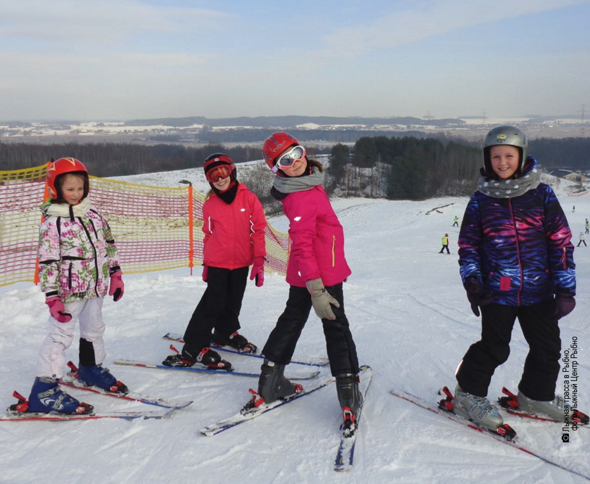
Лыжная трасса в Рыбно

начинающих кататься на горных лыжах, имеются школы с инструкторами обучения. Спортивный Центр Шелмент расположен на Горе Есёновой (взгорье натурального происхождения высотой 252 метра), на берегу озера Шелмент Вельки, откуда расстилается прекрасная панорама. Здесь можно пользоваться несколькими горнолыжными трассами